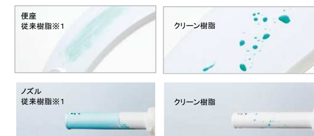
※1:2012年以前の汚防成分を含まない樹脂